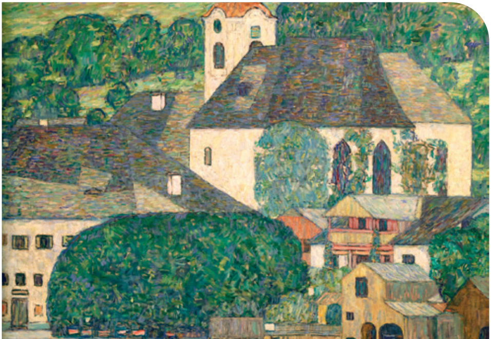
Foto: Gustav Klimt, Kirche in Unterach am Attersee, 1916