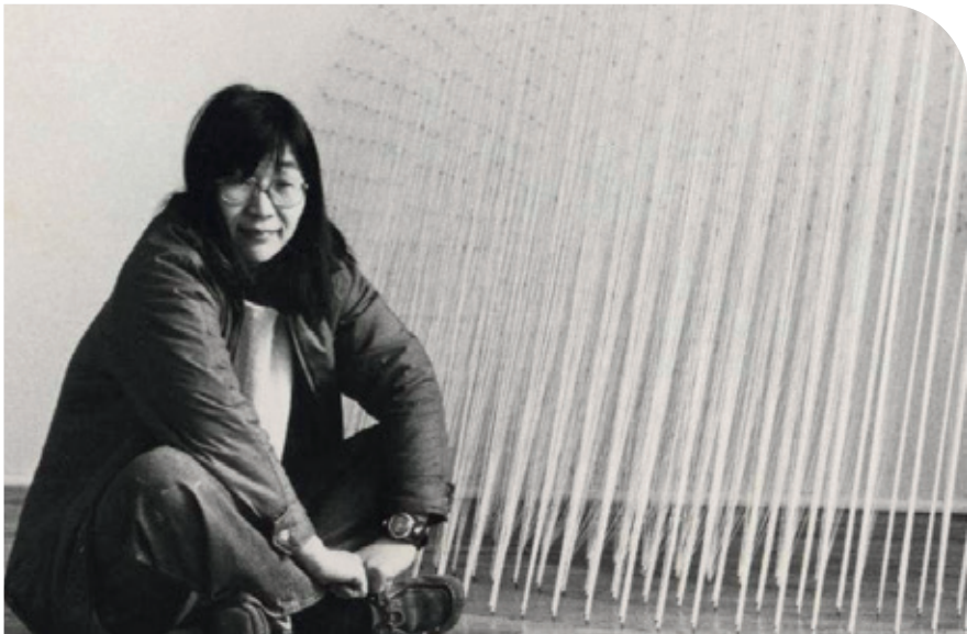
Foto: Kazuko Miyamoto in front of Archway to cellar 1978 Installation view PS1 New York (002)